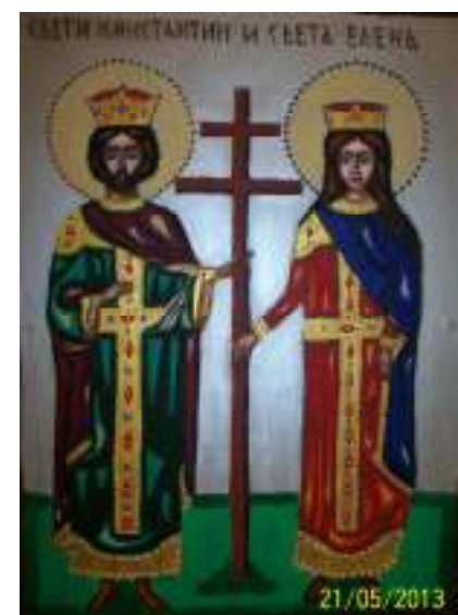
«Св. Константин и Елена»