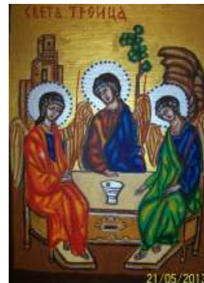
«Света Троица» по А.Рубльов