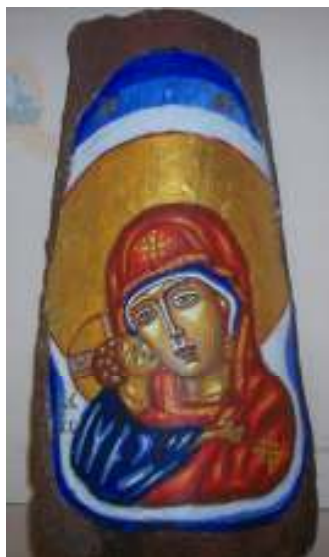
«Богородица с Младенеца»