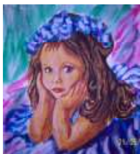
«Една малка дама в синьо»

Осъществява се с финансовата подкрепа на СО - дирекция „Култура”