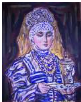
«Жената със самовара»